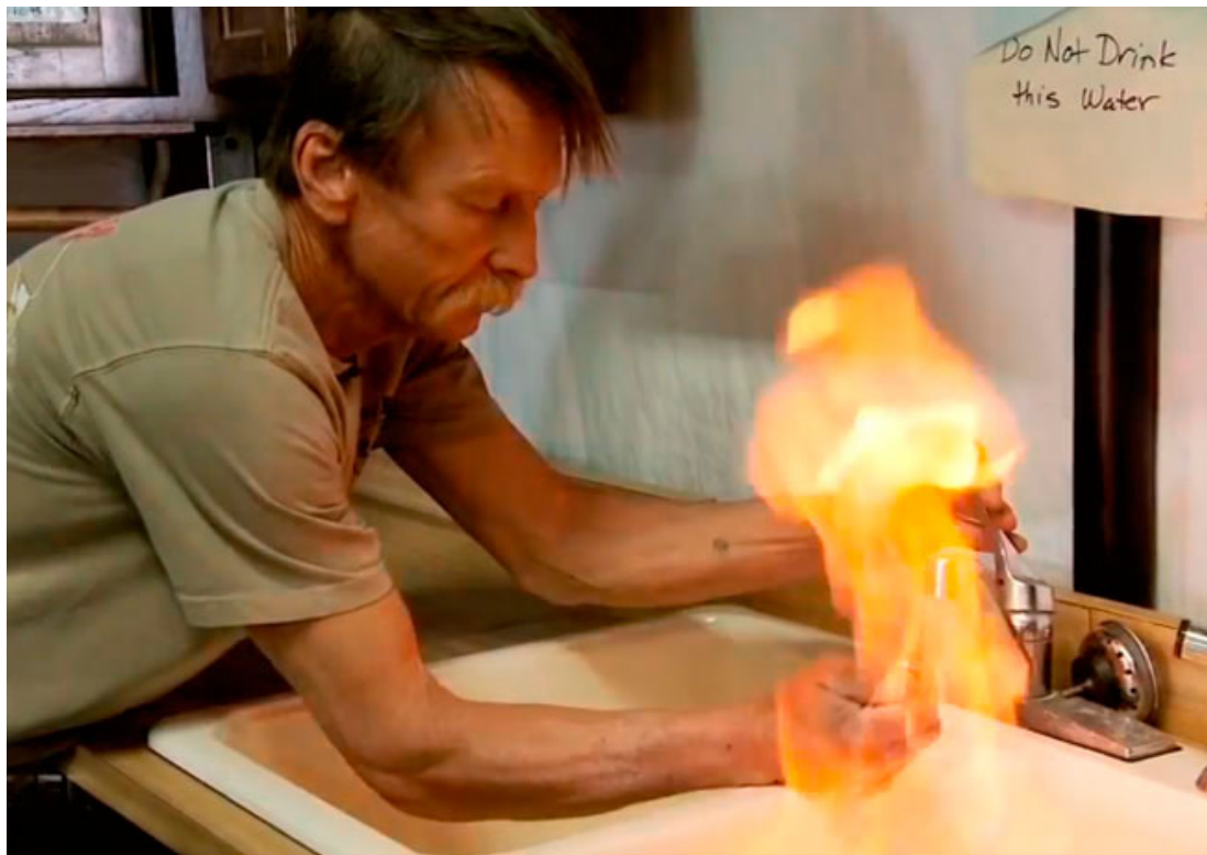
Methane coming out of the tap, you can set it alight