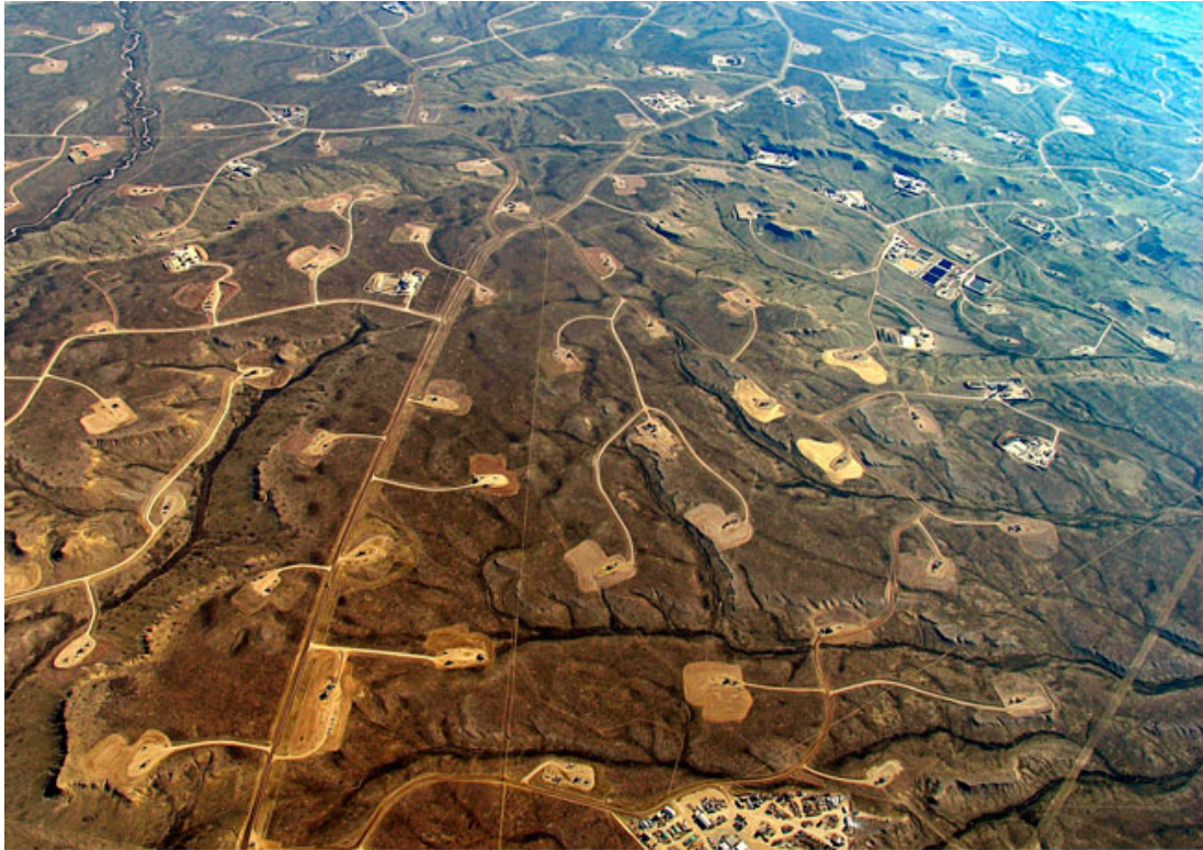
Aerial view of intensive fracking in the US 美国密集式裂口的空照