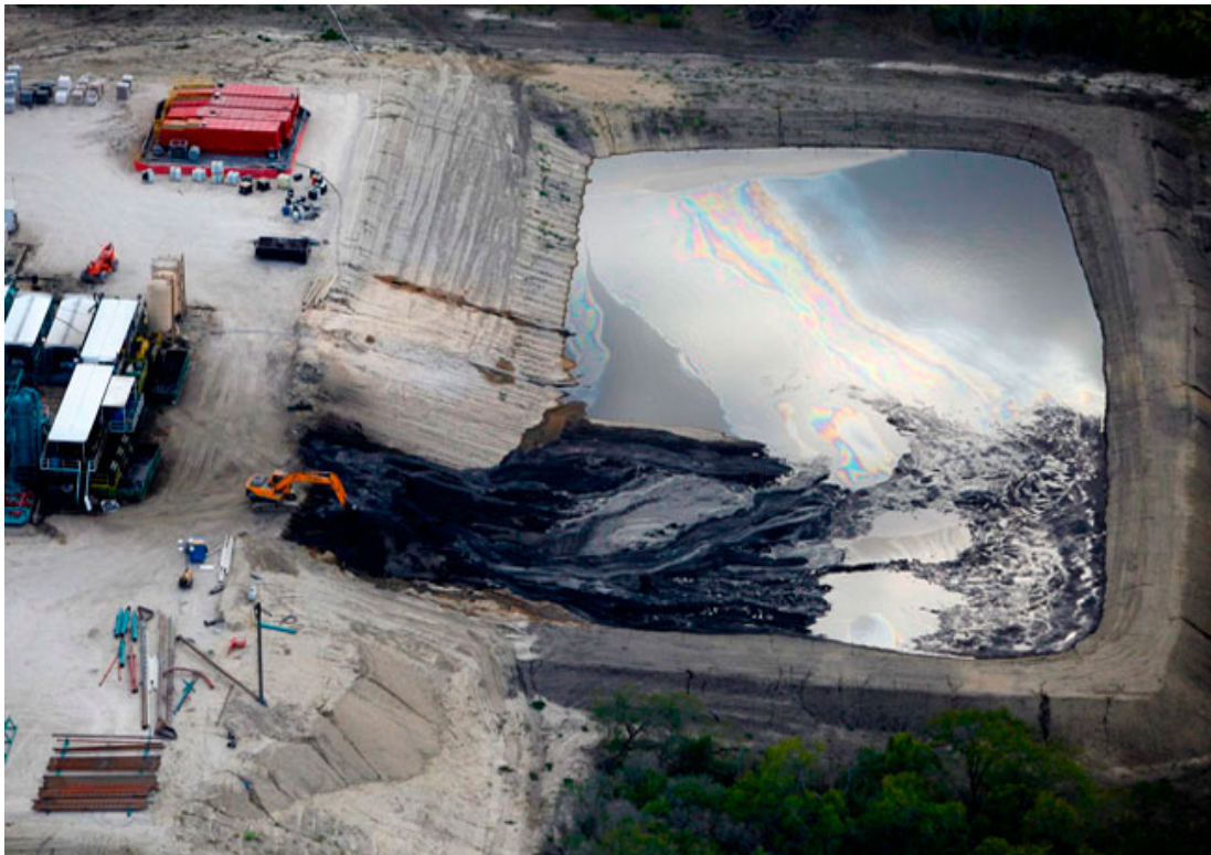
Sludge pits/ponds are used to hold exploration and production waste 泥池用来置放探勘及制造过程中产生的废弃物