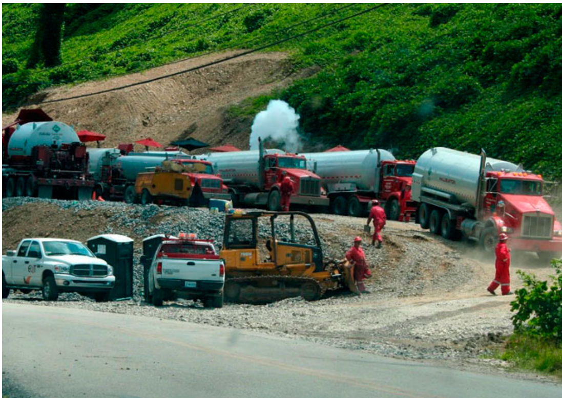
Millions of gallons of water are pumped or trucked to the fracking site and even more trucks carry away the waste. Imagine this in an English country road.

甲烷从水龙头流出，你可以点燃它 百万加仑的水被抽取或用卡车运到裂缝，甚至比更多的卡车把废物运出来。想想 景象生在英国道路会是什么样子。