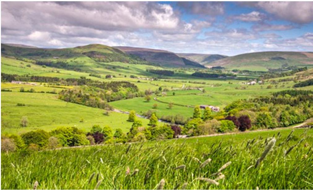
蘭開夏郡，座落在鮑蘭森林的霍德谷地，壓裂公司的主要目標之一。