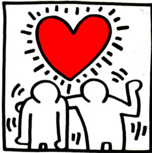
點一下圖一起連署