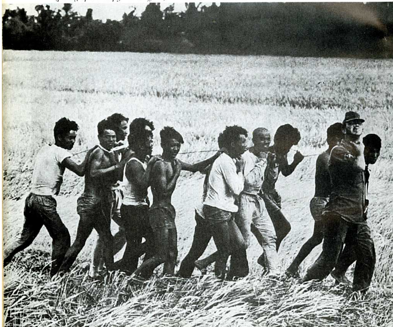
15 American soldier and 'suspected Vietcong', Vietnam, ( photograph: Philip Jones Griffiths )

自1986年他出版他的著作“英雄”之后，我就开始读他的书和文章。在“英雄”那本书，约翰在越战中担任记者的那一部分，当时美国为了强加它的霸权，建立世界领导权（及创造地狱）所做的一切，是令人难以置信的，甚至超越了恶魔的想象力。